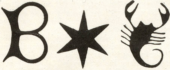
Die bischofszellischen Leinwandzeichen: B, Stern und Skorpion.

unerkannt im hiesigen Bürgerarchiv gelegen, bilden heute einen Bestandteil unseres neugegründeten Ortsmuseums und legen Zeugnis ab von einstiger blühender Industrie.